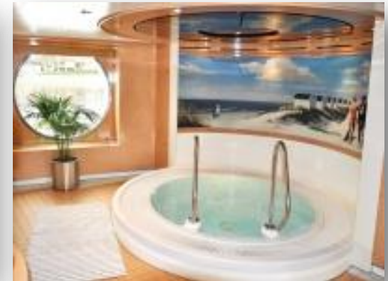
Сауна и джакузи