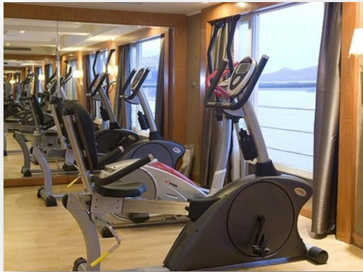
Фитнес - центр